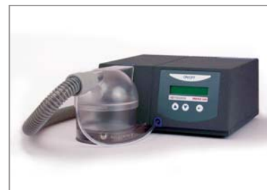
TREND 500, AquaTREND III